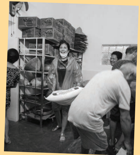
Die Mitarbeiter*innen des Dorfes bemühten sich, gelagerte Lebensmittel etc. vor dem ansteigenden Wasser in Sicherheit zu bringen.