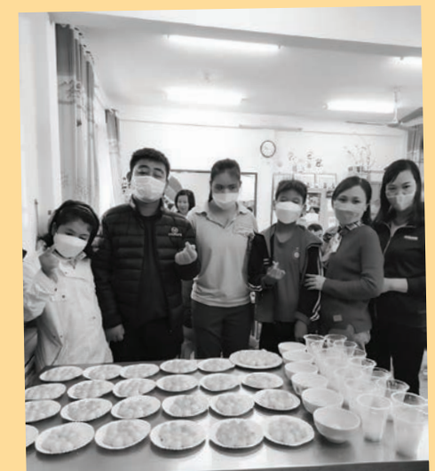
Jedes Jahr zum "Han Thuc" Tetfest werden in Vietnam traditionell kleine, runde Kuchen gebacken, die im Anschluss gemeinsam gegessen werden, während man der Verstorbenen gedenkt. Dieser Tradition sind die Kinder gemeinsam mit ihren Lehrern nachgekommen.