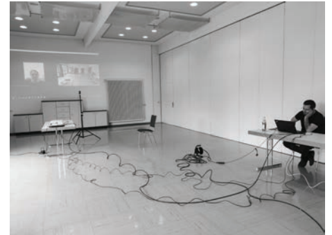
Probelauf für die erste hybride Mitgliederversammlung